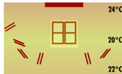
Panneaux rayonnants ECOSUN

L'intensité du rayonnement est influencée surtout par la température superficielle – plus elle est grande, moins de chaleur (proportionnellement) est enlevé par convection. L'air s'écoulant n'est pas capable de refroidir suffisamment la surface, et l'élément rayonnant augmente. C'est évident sur les panneaux à haute température, où – grâce à la température superficielle plus grande – la part de rayonnement est plus grande. C'est pourquoi la position de l'appareil chauffant influe sur la part de l'élément rayonnant. Le panneau rayonnant, installé en position horizontale au-dessous du plafond, transmet la plupart de l'énergie par rayonnement, parce que l'air ne peut pas circuler. Si, cependant, le même panneau est installé en position verticale, la part de la convection augmente de façon importante – l'air chauffé par la surface de l'appareil chauffant commence à remonter, en créant la circulation naturelle.