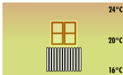
Chauffage par convection